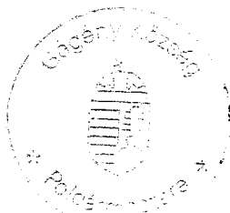
Zakor Ildikó polgármester