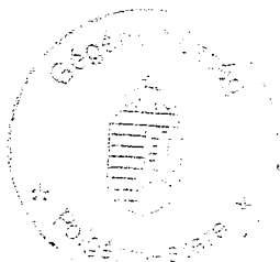
Zakor Ildikó polgármester